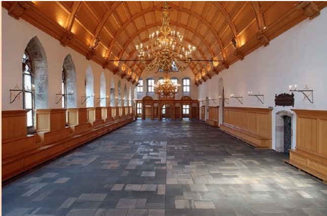
Historischer Rathaussaal