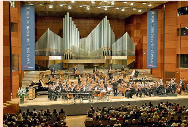
Meistersingerhalle Großer Saal, Foto: Jutta Missbach